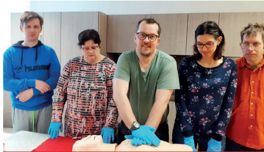
Beim Erste-Hilfe-Kurs haben die Bewohnerinnen und Bewohner der AWO-Wohnstätte „Engelswiese“ jede Menge gelernt.