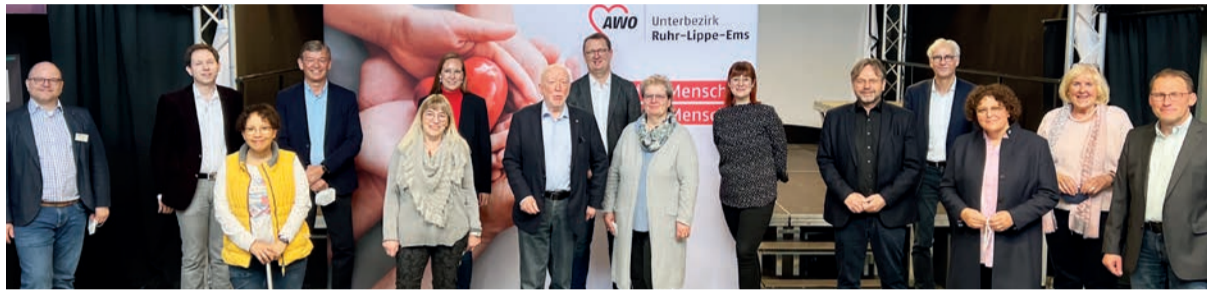
Im Jugendfreizeitzentrum kam die AWO Ruhr-Lippe-Ems mit vielen Expert*innen zum Thema Kinderarmut ins Gespräch.

Der Veranstaltungsort war bewusst gewählt: In dem Quartier Lüner Höhe in Kamen ist im Zusammenwirken der Stadt Kamen und des AWO-Familienzentrums „Atlantis“ mit vielen weiteren Akteur*innen bereits ein gutes Netzwerk gegen Kinderarmut entstanden. Doch trotz großer Anstrengungen, beispielhafter Quartiersarbeit und zahlreicher Initiativen steigt die Kinderarmut: Im Kreis Unna lebt fast jedes fünfte Kind in einem Haushalt mit SGB II-Bezug. Als arm gilt, wer über weniger als 60 Prozent des mittleren Haushaltseinkommens verfügt. In NRW sind 23 Prozent, also nahezu jedes vierte Kind armutsgefährdet. Im Zentrum der Veranstaltung stand deshalb die