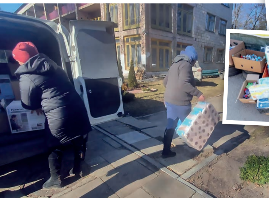
Die bei der AWO Ruhr-Lippe-Ems eingegangenen Sachspenden wurden von Freiwilligen direkt in die betroffenen ukrainischen Gebiete gebracht, wo die verschiedenen Hilfsgüter dringend gebraucht werden.