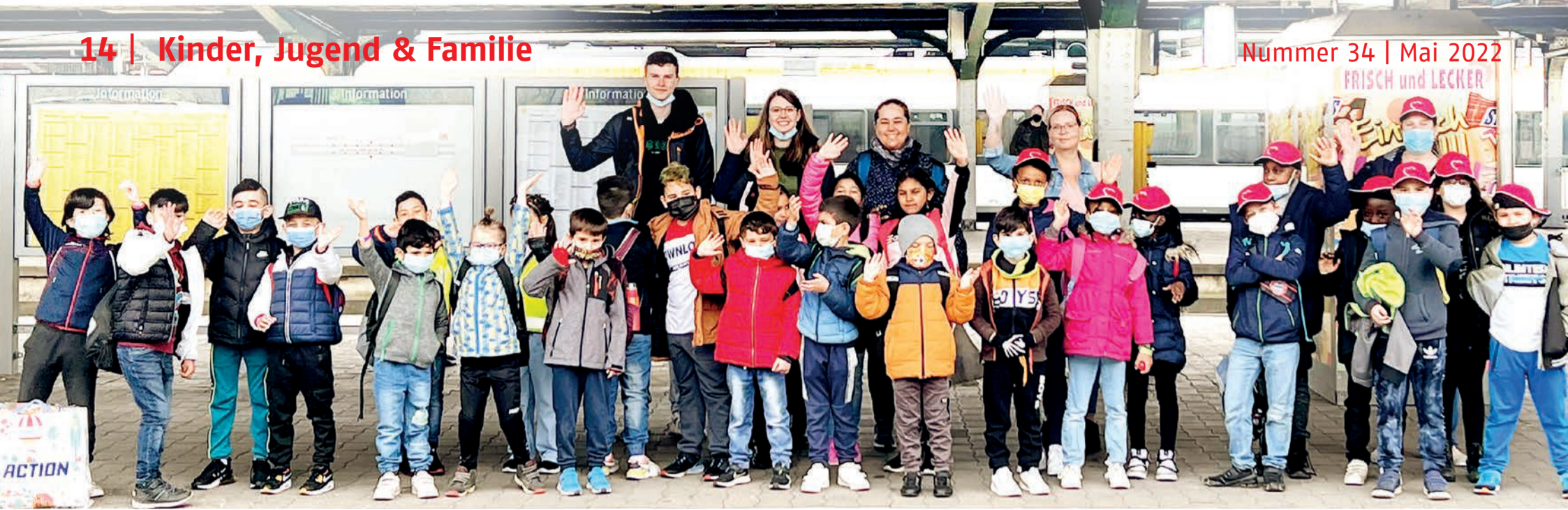
Voller Vorfreude auf das OGS-Ferienprogramm: Hier sind die Kinder der Offenen Ganztagschule der Wilhelm-Busch-Grundschule mit ihren Betreuer*innen auf den Weg in die Zoom-Erlebniswelt in Gelsenkirchen.