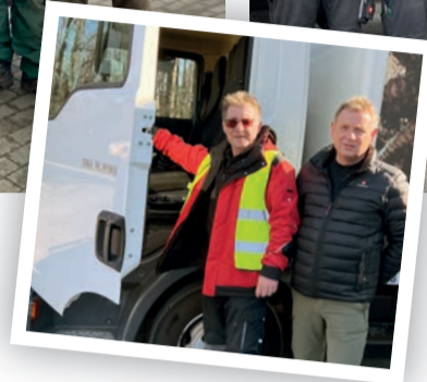
Vier Stromaggregate, Kabeltrommeln und Strahler steuerte die GSW der Spendenaktion der AWO Ruhr-Lippe-Ems bei. Diese besonderen Hilfsgüter sollen Strom und Licht ins Krisengebiet bringen.