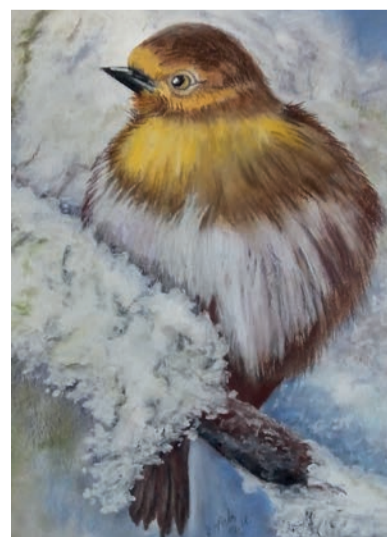
Rotkehlchen auf verschneitem Ast