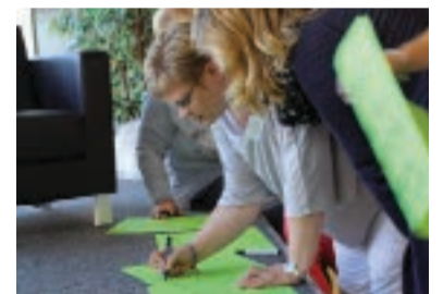
Gute Ideen schnell zu Papier gebracht. Kreativität war im Rahmen des „Go! AWO“-Prozesses gefragt.

Vor diesem Hintergrund wurde unter anderem das gesamte Organigramm des AWO-Unterbezirks auf den Prüfstand gestellt und überarbeitet. Das Ergebnis: Es gibt nun drei zentrale Bereiche: die Abteilung Kindertageseinrichtungen, den Bereich Beratung, Betreuung und Pflege sowie den Bereich Zentrale Dienste. „Wir glauben hiermit, eine übersichtliche und nachvollziehbare