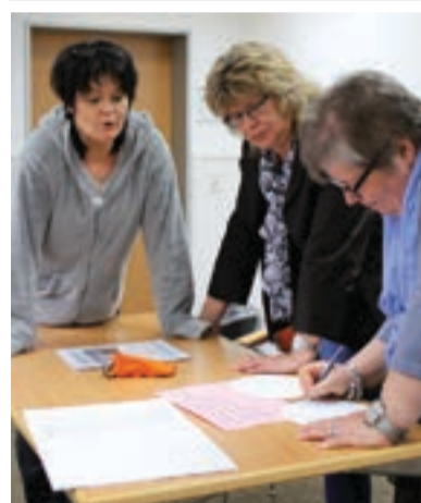
Konzentrierte Arbeit in der Gruppe

Die Herausforderungen im Kita-Alltag wachsen: Sich wandelnde Familienformen, Integration und Inklusion sind nur einige der vielen Aufgaben, die eine Kita-Leitung Tag für Tag mit ihrem Team zu meistern hat. Hinzu kommt ein zunehmend organisatorischer Aufwand. Die kollegiale Beratung soll den Pädagoginnen und Pädagogen helfen, sich gegenseitig zu stützen.