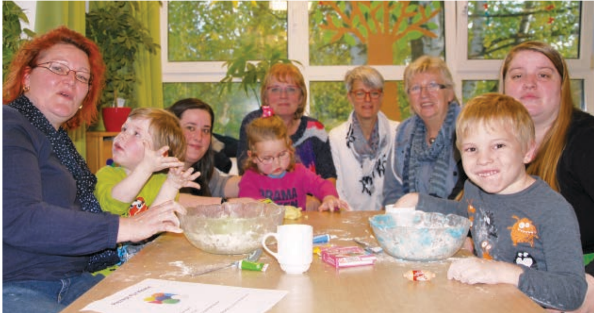
Eine Gruppe alleinerziehender Mütter mit ihren Kindern trifft sich regelmäßig in der AWO-Kita Regenbogen in Schwerte. Sie hat sich aus dem Projekt „Netzwerk Familienpaten“ gebildet.