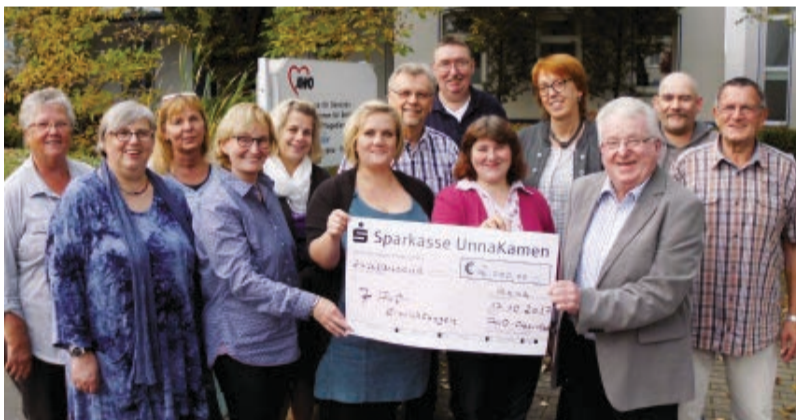
2.000 Euro hat der Ortsverein Unna-Oberstadt für verschiedene AWO-Einrichtungen gespendet. Das Geld stammt aus dem traditionellen Glühweinverkauf.