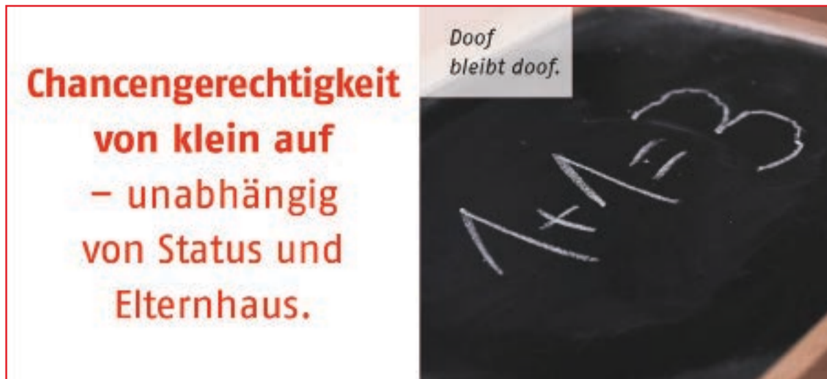
Kampagne der AWO: Stammtisch-Parolen dürfen keine Chance haben.

Die großen Probleme und Herausforderungen unserer Zeit sind bei der Bundestagswahl 2017 auf der Strecke geblieben. Sie können und werden uns aber ins Stolpern bringen – wenn wir nicht endlich etwas dagegen tun.