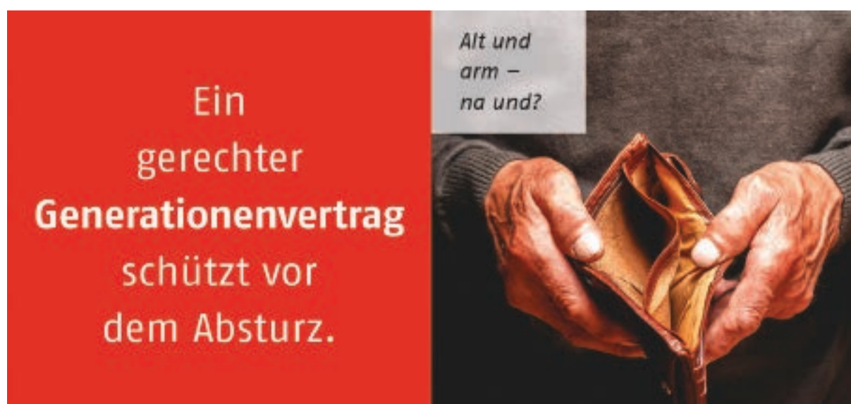
Gegen die Gleichgültigkeit: Die AWO wirft den Motor der Veränderung an, wenn es darum geht, Ungerechtigkeit anzuprangern.

Das alles sind Herausforderungen, die keiner alleine stemmen kann. Weder die Parteien, noch die Wohlfahrtsverbände oder die Gewerkschaften. Und die Kirchen? Die ziehen sich aus der Verantwortung in den Quartieren mehr und mehr zurück. Was wir aber jetzt brauchen und wollen, ist eine neue Allianz des Anpackens, die sich ohne Wenn und Aber für soziale Gerechtigkeit einsetzt. Die AWO