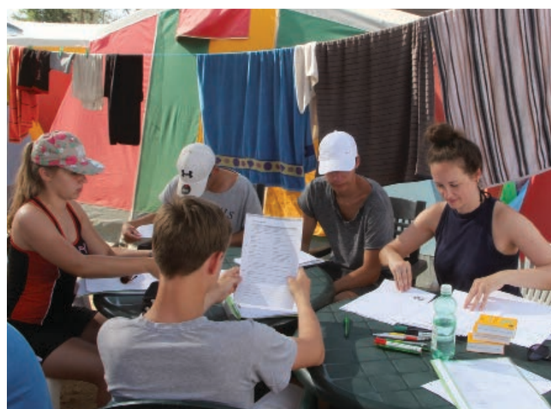
Lernen unter der Sonne Spaniens und dann zum Strand. Die Lernfreizeit, die erstmals 2015 angeboten wurde, ist gefragt.

Trotzdem freuen sich alle jetzt schon auf den geplanten Neubau in der Mitte Holzwickedes. Die Planungen laufen bereits auf Hochtouren. Beteiligt sind der Kreis Unna als Träger der Jugendhilfe, die Gemeinde Holzwickede und die AWO.