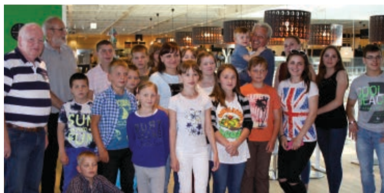
Glückliche Gesichter nach dem Ausflug der Kinder an die Möhne