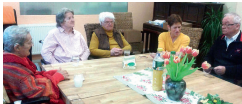
Die Gemeinschaft wird in der Einrichtung in Selm gepflegt.