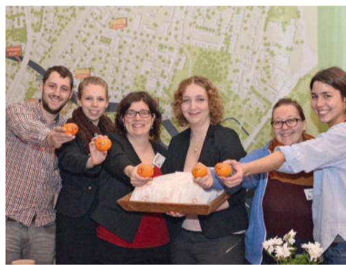
Das Bezirksjugendwerk war in Bocholt mit einem eigenen Stand vertreten