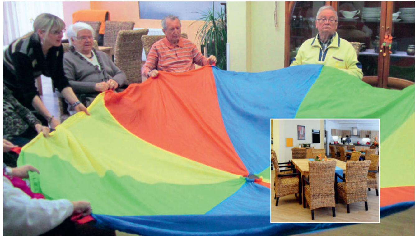
Blick in den Aufenthaltsraum der AWO-Tagespflege Selm. Hier wird viel gemeinsam unternommen.