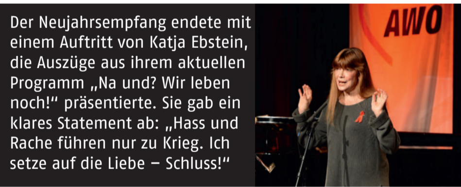
Katja Ebstein bildete mit ihrem Auftritt Abschluss und einen Höhepunkt des Neujahrsempfangs der AWO Westliches Westfalen.

Die Belastungsgrenzen im Blick haben – Experten konzipieren Schulung